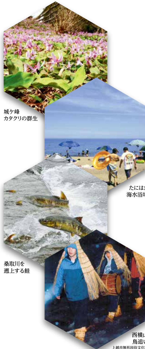
城ヶ峰 カタクリの群生