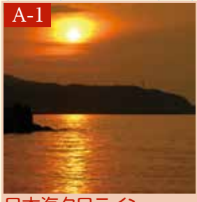
日本海夕日ライン