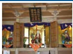
C-2 有間川 地蔵堂 長寿、豊作、豊漁を願う地蔵文殊弁天をまつる。