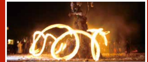
B-4 毎年1月15日 西横山 オーマラ 燃えさかる松明を回して「オーマラ」と叫びながら、サイノカミのやぐらの周りを廻り、無病息災を祈る西横山の小正月行事。当日に嫁祝いも行われる。(上越市無形民俗文化財)