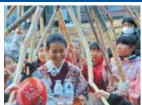
B-5 西横山 嫁祝い 嫁いで初めて迎える正月に子宝の恵みを願う、桑取谷の小正月行事。