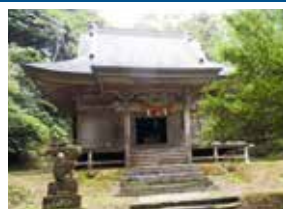
E-2 長浜・式内社 阿比多神社 国づくりと学問の神様をまつる。ヤブツバキの自然林もある。