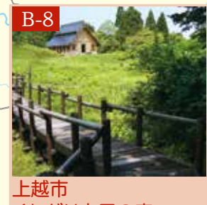
上越市 くわどり市民の森