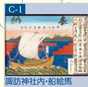
諏訪神社内・船絵馬 上越市文化財