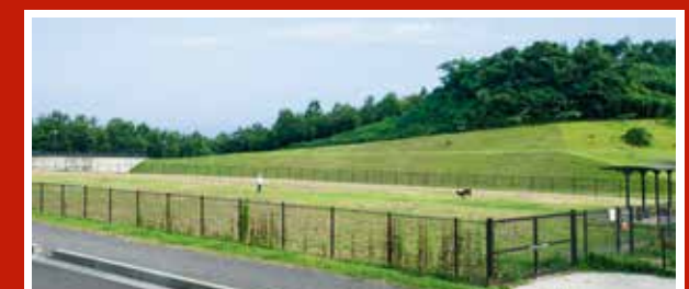
D-2 西戸野 たにほま公園ドッグラン 周辺エリア有数の大きさを誇る海を望むドッグラン。小型・大型犬用と2面利用できます。