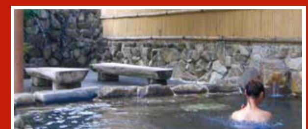
B-8 皆口くわどり湯 湯ったり村 豊かな自然の中で心も体もリフレッシュできる温泉宿泊施設です。(日帰り入浴もできます)