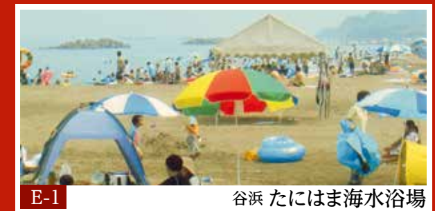
E-1 谷浜 たにほま海水浴場 どこまでも続く美しい海岸線。