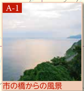
市の橋からの風景