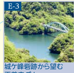
城ヶ峰岩跡から望む 正善寺ダム