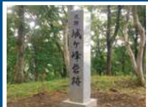
E-3 中桑取 城ヶ峰岩跡 上杉謙信公が築いた岩の一つ。守備を担当