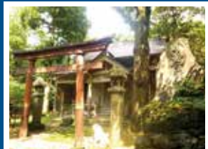
A-1 茶屋ヶ原 乳母嶽神社 「子育ての神様」、「乳の神様」として崇拝。