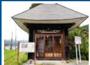
B-7 北谷 地蔵堂 元旦に氏神様にお参り後、地蔵様をお参り。