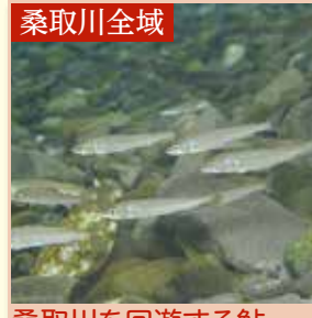
桑取川を回遊する鮎