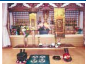
B-2 鍋ヶ浦 三十三観音 三十三に姿を変え、苦しみ・悩みを救う三十三体の観音像。