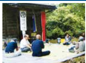
B-3 高住 地蔵尊 延命地蔵尊。地域の延命をお祝いするお祭り。