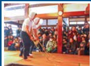
B-8 横畑 馬 馬をまね、水田耕作の豊作を祈った小正月行事。