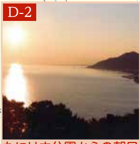
たにはま公園からの朝日